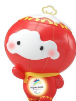
SHUEY RHON RHON