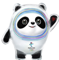
BING DWEN DWEN

https://www.beijing2022.cn/a/20190917/007546.htm